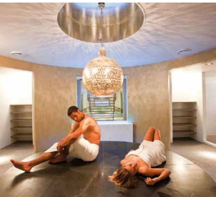
SPA SPORT HOTEL ZUIVER

Een hamam of Oosters badhuis is een heerlijk ontspannen plek waar mensen zich kunnen wassen en heeft van oorsprong een sterke sociale functie. De hamam heeft zich ontwikkeld vanuit de badhuizen uit het Romeinse Rijk en het Byzantijnse Rijk, in combinatie met de Centraal-Aziatische en Turkse traditie van het stoombaden en de islamitische rituele reiniging. Tegenwoordig hebben steeds meer wellnesscentra ook een hamam in huis of geven zij speciale hamambehandelingen.